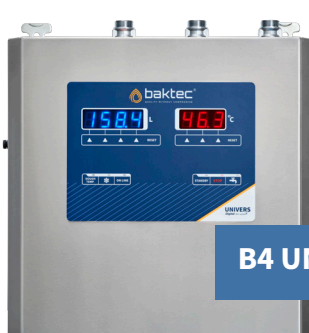
B4 UNIVERS II