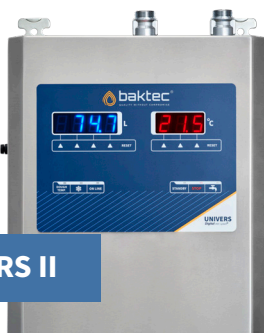
B2 UNIVERS II